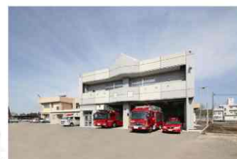
消防指令センター