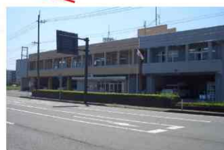
菊池広域連合消防本部(南消防署) 菊陽町大字原水7番地1