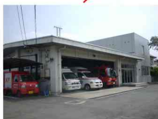
泉ヶ丘消防署 合志市豊岡2526番地10