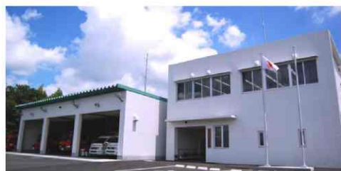
西消防署 合志市合生4107番地1