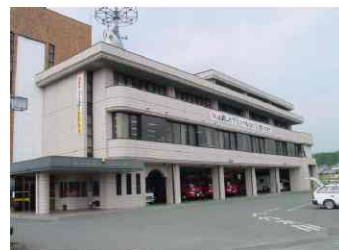
北消防署 菊池市赤星2080番地